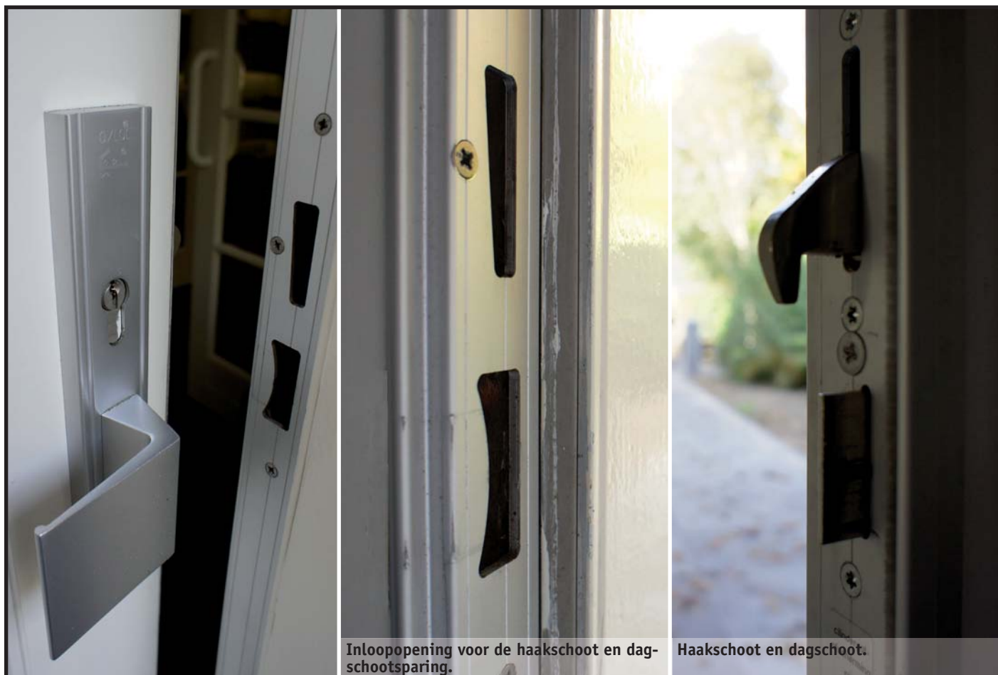
Inloopening voor de haakschoot en dagschootsparing.