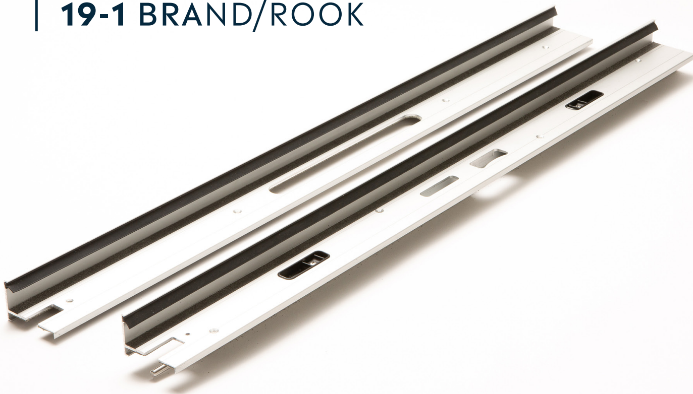
Afbeelding 1. Productfoto uitvoering 19-1 Brand/Rook