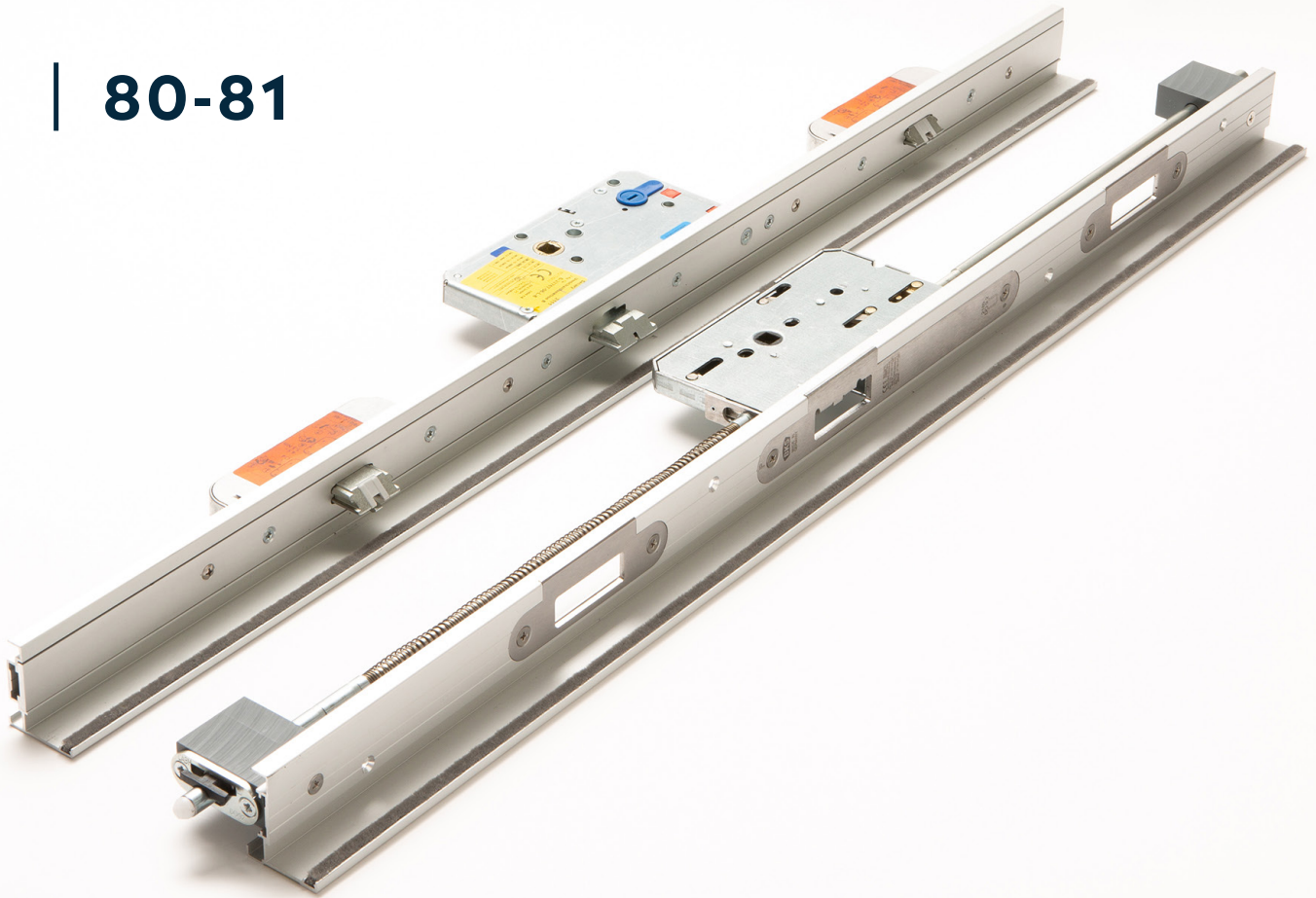
Afbeelding 1. Productfoto uitvoering 80-81-82-83